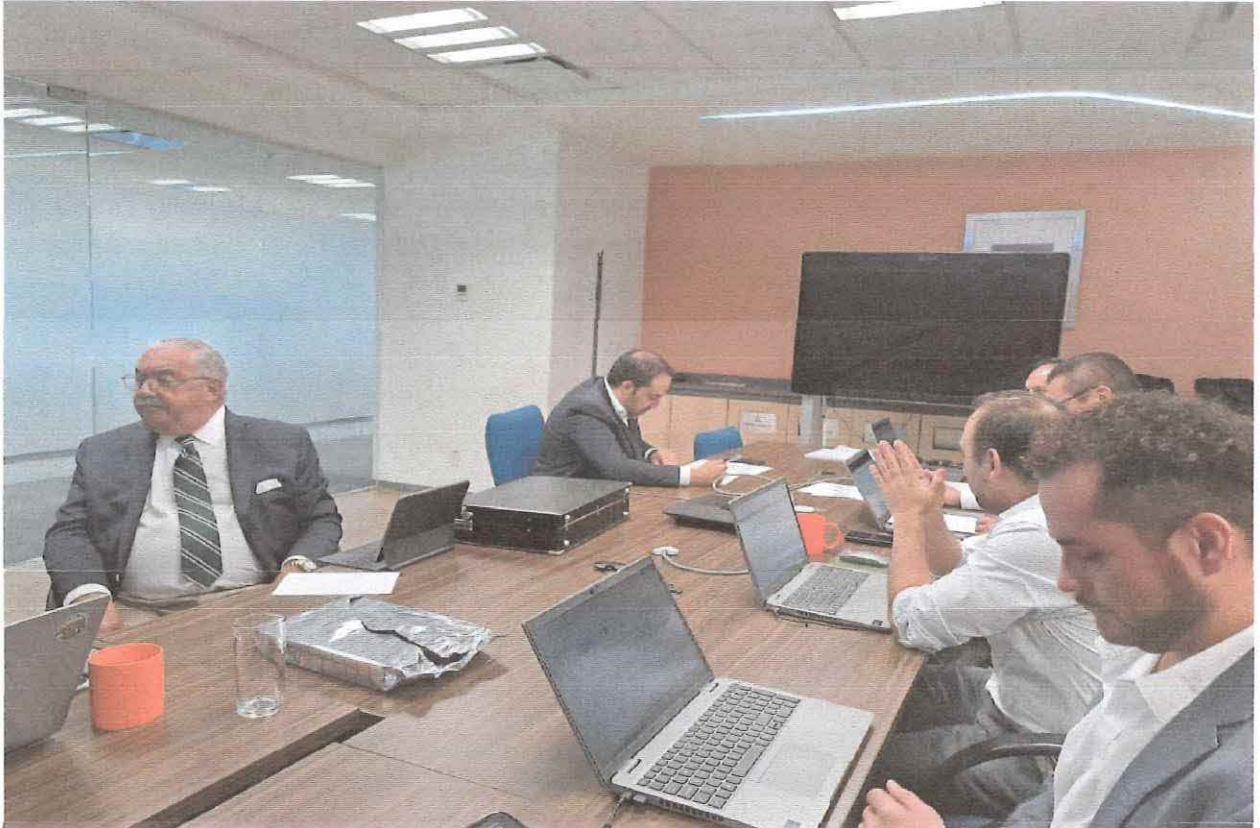
Ilustración 14. Desarrollo de las actividades del numeral 6.4.1 de las Bases

Mediante el oficio IFT/222/UER/DG-EERO/084/2024 el 11 de noviembre de 2024, el IFT informó a esta representación lo acontecido del acto de notificación del fallo al Participante Ganador, de acuerdo con los párrafos previos.