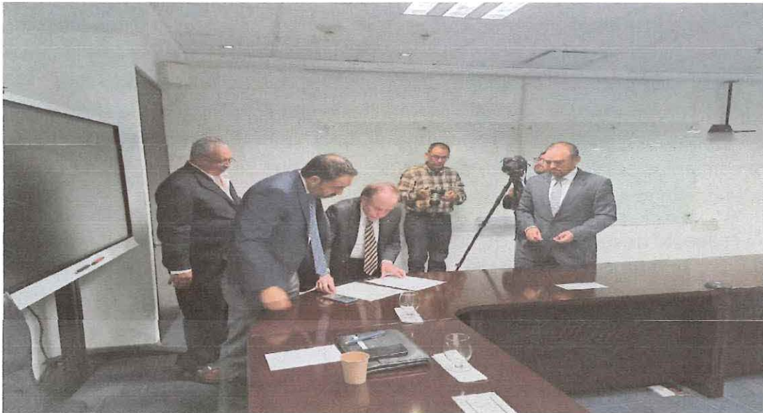
Ilustración 8. Desarrollo del Procedimiento de las actividades del numeral 6.3.1 de las Bases

A continuación, la evidencia fotográfica del evento desarrollado en los párrafos que anteceden: