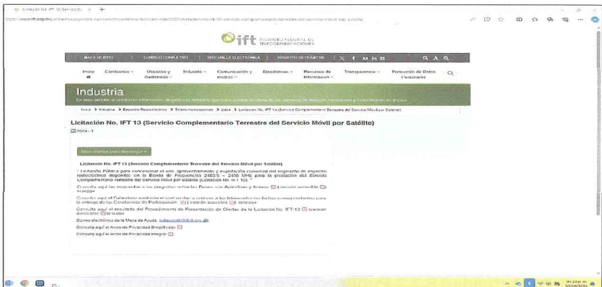
Ilustración 12. Publicación de los resultados del PPO en el Portal de Internet del Instituto

Desplegando de dicha liga la imagen consultada, misma que después de haberla corroborado en el portal de Internet del Instituto, se incorpora al presente informe, con fines de atestiguamiento de dicha publicación: