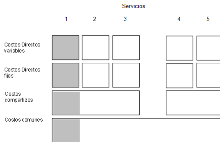
Gráfica 1: Costo Incremental Total Promedio de Largo Plazo

El Costo Incremental Total Promedio de Largo Plazo (en lo sucesivo, el "CITLP") toma en consideración, los costos directamente asignables, así como los costos comunes y compartidos; para la recuperación de estos últimos se utiliza algún mecanismo de asignación, como puede ser el de Márgenes Equi-proporcionales.